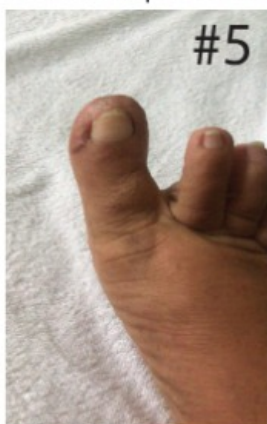
Imagen proporcionada por la paciente el Miercoles 13 de Febrero del 2020 Hola los zapatos que creí nunca me los iba a poner los estoy usando pues eran los zapatos cerrados 142 días después iniciado el tratamiento sola en la casa, sin uso de antibióticos ni otro tipo de intervención, sin complicaciones de inflamación, infección ni dolores incapacitantes. Después de tener un riesgo de amputación de un 90% La paciente está haciendo una vida normal. Resultados nunca vistos con otros métodos terapéuticos con la seguridad que podemos obtener con Polyactil -N, Petroactil, y Dynactil

142 días después iniciado el tratamiento