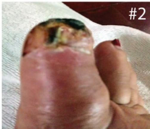
Imagen proporcionada por la paciente Miercoles 2 de Octubre del 2019 Eso q se ve amarillo creo es grasa pues se ha ido cayendo lo negro ¿y usted como se siente? [4:40 p.m., 2/10/2019] Demasiado bien ya puedo caminar mejor y siempre guardando reposo muchas gracias