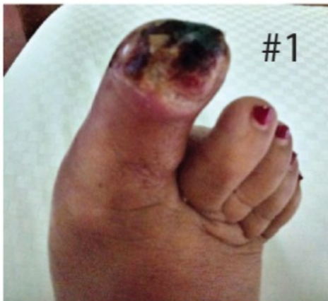
Imagen proporcionada por la paciente el Miercoles 25 de Setiembre del 2019 Paciente Diabetica le cayo una tabla en el dedo y en la medicina privada le indicaron la posible amputación. En este estado habia usado crema de antibiotico. Ya se cayo la uña