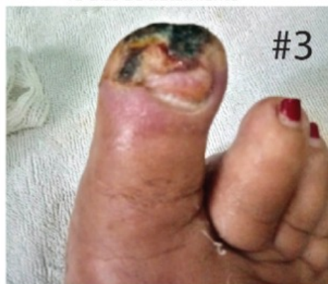
Imagen proporcionada por la paciente Lunes 7 de Octubre del 2019 ¿Como lo ven? [1:40 p.m., 7/10/2019] Se ve muy bien lo negro se tiene que caer solo, el tejido nuevo viene debajo vemos que tiene buen color de la piel y está muy desinflamado, es muy importante mantener desinflamado el dedo ya que la inflamación complica las cosas y provoca dolor.