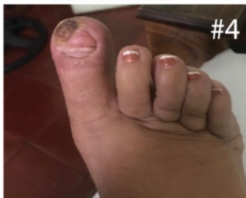
Imagen proporcionada por la paciente Miercoles 13 de Noviembre del 2019 La Paciente: Así está mi dedo buenos dias La parte más golpeada es la que va más despacio

142 días después iniciado el tratamiento